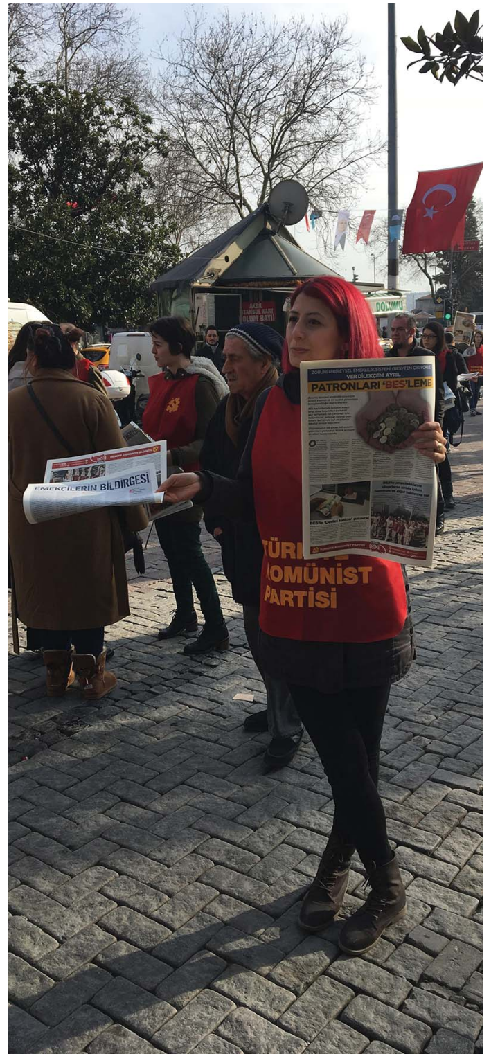
A TÖRÖK KP AKTIVISTÁI AZ UTCÁN

A kommunisták feladata az, hogy mind hazai, mind nemzetközi téren készüljenek a forradalmi válságra és szervezzék a munkásosztályt.