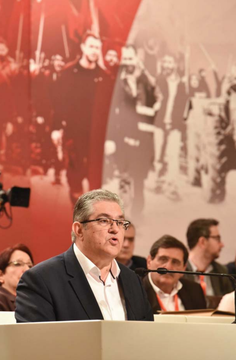
DIMITRIS KOUTSOUMPAS, A PÁRT FŐTITKÁRA

A Görög KP az elmúlt négy évben két parlamenti választáson és négy népszavazásban vett részt. A párt megőrizte parlamenti pozícióit, sőt némileg növelte is 5.54 százalékra. Az EP-választásokon a párt 6.1 százalékot kapott. Görögországban 5 kommunista polgármester van, Patras, Kaisariani, Haidari, Petroupoli és Icaria településeken.