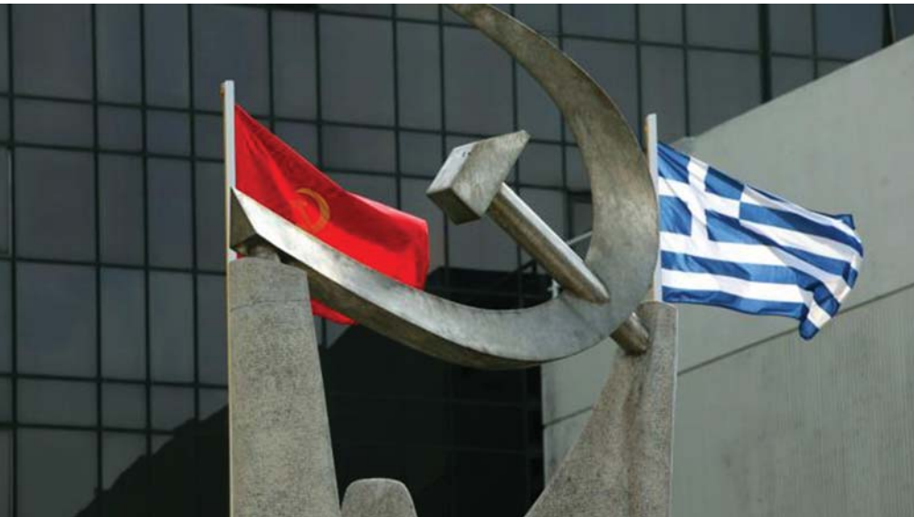
A GÖRÖG KP SZÉKHÁZÁN A VÖRÖS ÉS A NEMZETI ZÁSZLÓ

A Görög KP erősítette propaganda tevékenységét. A párt napilapja, a Rizospastis és a 902.gr hírportál fontos eszköz a párt kezében.