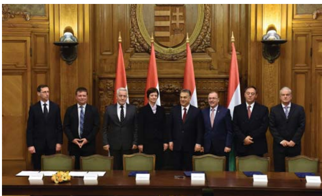
MEGÁLLAPODÁS A MINIMÁLBÉR EMELÉSÉRŐL 2016 NOVEMBERÉBEN

A Fidesz megakadályozta a tőke elleni osztályharc további éleződését. Magyarországból nem lesz Görögország! – mondta többször a miniszterelnök. Egyszerre alkalmazta a mézesmadzag és a furkósbot elvét. Egyrészt, megadóztatta a nagytőkét, így a nagy bankokat, és ezeknek a pénzeknek egy részéből elkezdett osztogatni. Csökkentette a rezsiköltségeket, emelte a minimálbért, és jelentős emelést adott több társadalmi