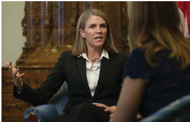
Colleen Bell volt amerikai nagykövet

A tüntetések azonban nem döntötték meg a kormányt. A parlamenti ellenzék nem tudott egységes programot