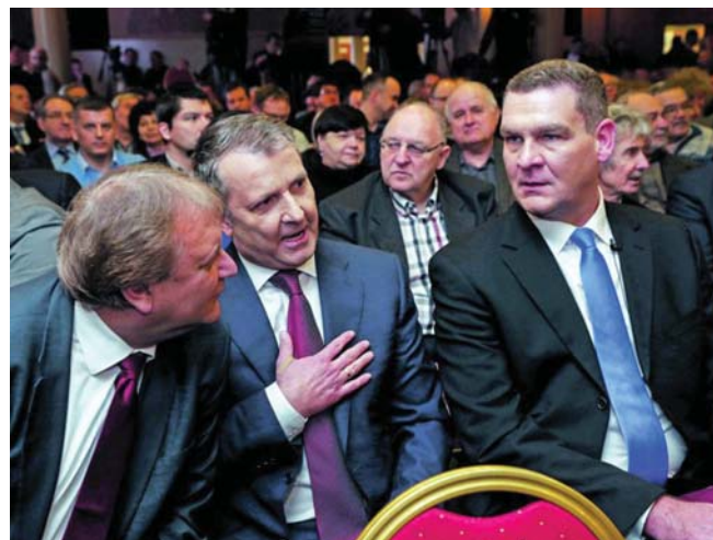
BOTKA LÁSZLÓ AZ MSZP VEZETŐIVEL

Azt is tudja, hogy a magyar kapitalizmus egy ilyen váratlan fordulat esetén aligha kapna hatékony segítséget az EU és a NATO intézményeitől. Ezt bizonyítja a migránsügy is. Nem kíván sem az EU-ból, sem a NATO-ból kilépni, de biztonsági pilléreket épít ki. Ilyen a magyar–orosz, vagy a magyar–kínai együttműködés, és ilyen a visegrádi országok együttműködése is. A belpolitikában Orbán világossá tette, hogy a stabilitás érdekében, azaz egy társadalmi forradalom elkerülése