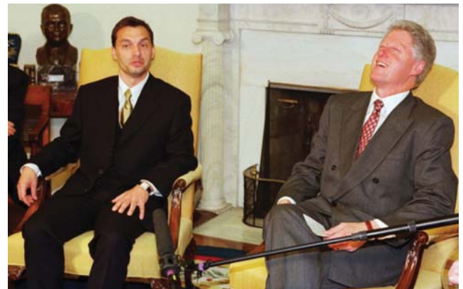
ORBÁN VIKTOR ÉS BILL CLINTON 1998-BAN

A tőke 1998-ban bevetette a tartalékot, Orbán Viktor Fideszét. A fideszesek fiatalok voltak, a falusi nagymamák is rájuk szavaztak, mondván, hogy a fiatalság a jövő. Orbán a közös kormányzásba bevonta az MDF maradvékát élén Dávid Ibolyával, illetve az akkor még jelentős Kisgazdapártot Torgyán József vezetésével. A Fidesz azonban mindkettőjüket lenyelte, elkezdett kialakulni az egységes konzervatív tábor, úgymond egy tábor, egy zászló. A fideszesek azonban túl kapzsiak voltak és tapasztalatlanok, 2002-ben veszítettek.