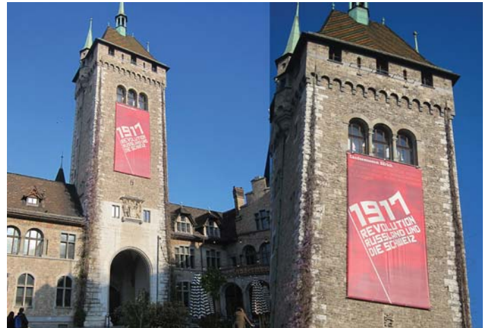
JUBILEUMI KIÁLLÍTÁS A SVÁJCI NEMZETI MÚZEUMBAN

A Nagy Október 100. évfordulójának tiszteletére gyarapítsuk újabb tagokkal pártunkat!