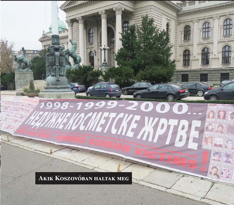
AKIK KOSZOVÓBAN HALTAK MEG