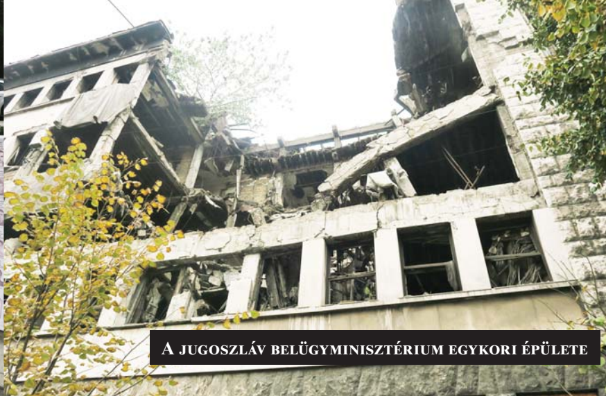
A NATO ÉS A KOSZOVÓI ALBÁNOK BŰNEIT NEM FELEJTİK