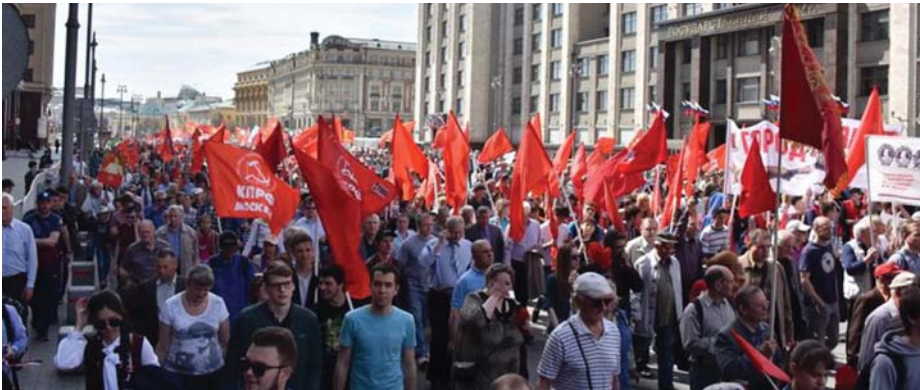
MÁJUS ELSEJEI FELVONULÁS

Május 27-én kezdi meg munkáját az Oroszországi Föderáció Kommunista Pártjának (KPRF) XVII. Kongresszusa.