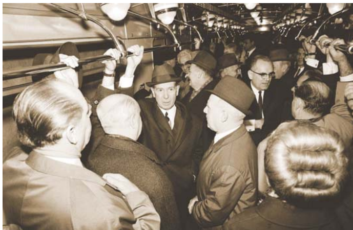
FOCK JENŐ MINISZTERELNÖK A METRÓ ÁTADÁSÁNÁL

vesz a helsinki értekezleten. Megindul az együttműködés a tőkés nyugattal. A nyugat erőlteti az emberi kapcsolatok bővítését. Egyre többen utaznak Magyarországról nyugatra, turistaként, majd tanulmányutakra.