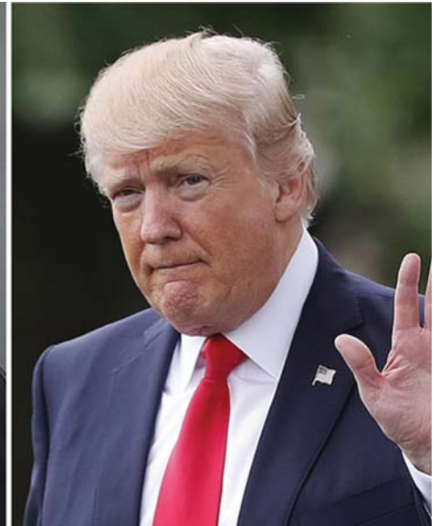
KIM DZSONGUN ÉSZAK-KOREAI ÉS DONALD TRUMP AMERIKAI ELNÖK