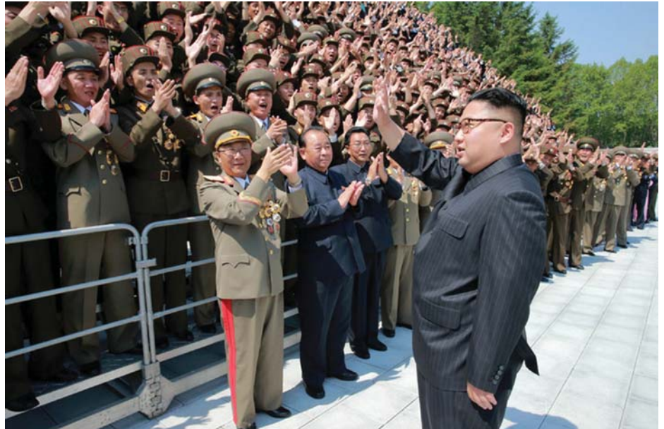
KIM DZSONGUN A HVASZONG12 KIFEJLESZTÉSÉBEN RÉSZTVEVŐ SZAKEMBEREKSEL

A KNDK vezetése ebben a helyzetben döntött a nukleáris erők további gyorsított fejlesztéséről. Az első perctől kezdve