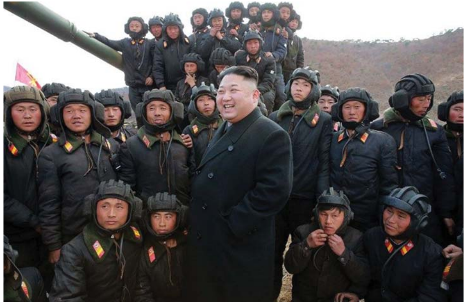
KIM DZSONGUN A KNDK EGYIK PÁNCÉLOS EGYSÉGÉNÉL

1996-ban a KNDK Szíriától beszerzett 9K79 Tocska típusú rakétarendszert (NATO-kód SS-21), amely alapján kifejlesztette