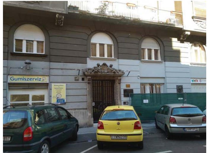
A TÁTRA UTCA 20/B 2017-BEN

Károly, fiatalnak számít, 40 éves. 1921. december 22-én születik meg a tőkés kormány és a munkásság nevében eljáró MSZDP megállapodása, a Bethlen-Peyer paktum. „A nemzet és az ország érdekeit a munkásság érdekeivel azonosnak tekintik...” – mondják a felek. Az MSZDP vállalja, hogy támogatja a kormány külpolitikai törekvéseit, tudomásul veszi a király-