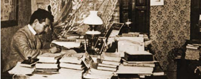
SZABÓ ERVIN A DOLGOZÓSZOBÁJÁBAN

Szabó Ervin, Schlesinger Sámuel Ármin néven született egy azóta eltűnt faluban, Árva megyében. A nép szavát akarta hallatni betegen is, folyamatosan dolgozva és nem sokkal az őszirózsás forradalom előtt halt meg 41 évesen. „Szabó Ervin halála talán nagyobb veszteség a holnapi Magyarországnak, mint a mainak”, írta róla Móra Ferenc. Az országos közkönyvtári rendszer az ő nevét viseli méltán Magyarországon.