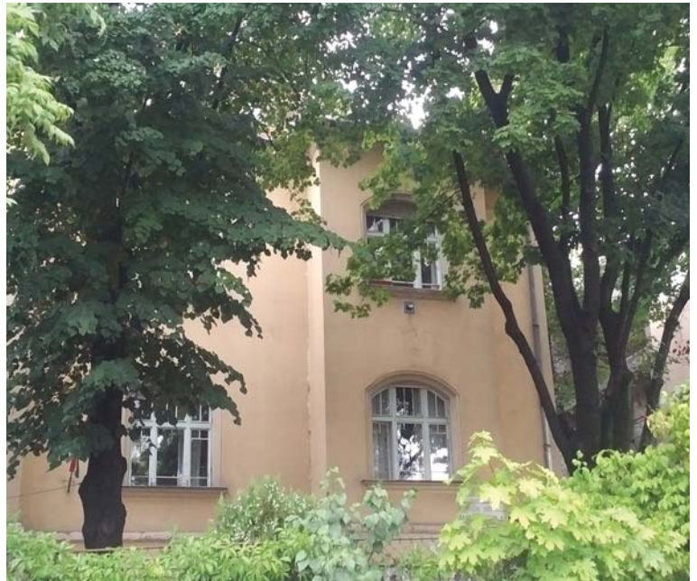
A MÉNESI ÚT 19. ALATTI VILLA 2017-BEN