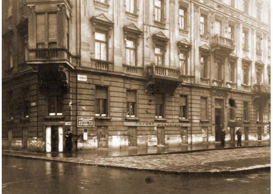
A TOMPA UTCA 14. SZÁM ALATTI ÉPÜLET

A dobálás után benyomultak a helyiségbe és „rettenetes” verekedés kezdődött. Ép bőrrel egyetlen nyilas sem menekült. Amikor Kémeri Nagyot és bandáját alaposan helyben hagyták, az ifjómunkások valóságos győzelmi mámorban vonultak végig a Körúton.