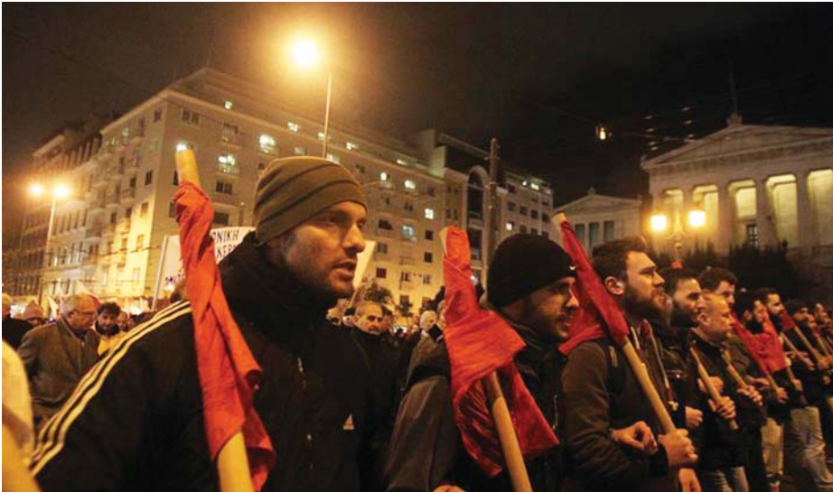
GÖRÖG DOLGOZÓK SZTRÁJKJA 2016-BAN

munkaidőben, azaz napi nyolc órában vannak foglalkoztatva. Ezért sok dolgozót csak 6-7 órában alkalmaz, és máris kevesebbet fizet.