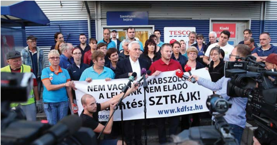
TESCO-DOGOZÓK SZTRÁJKJA 2017 SZEPTEMBERÉBEN

igyekeznek a tőkés munkaadókkal és a szakszervezetekkel megállapodni arról, hogy legyen egy kötelező legkisebb munkabér, amely kötelező minden munkáltató számára.