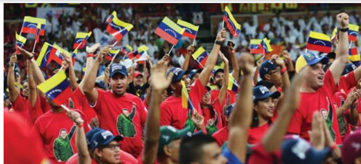
MINDANNYIAN VENEZUELAIK VAGYUNK!