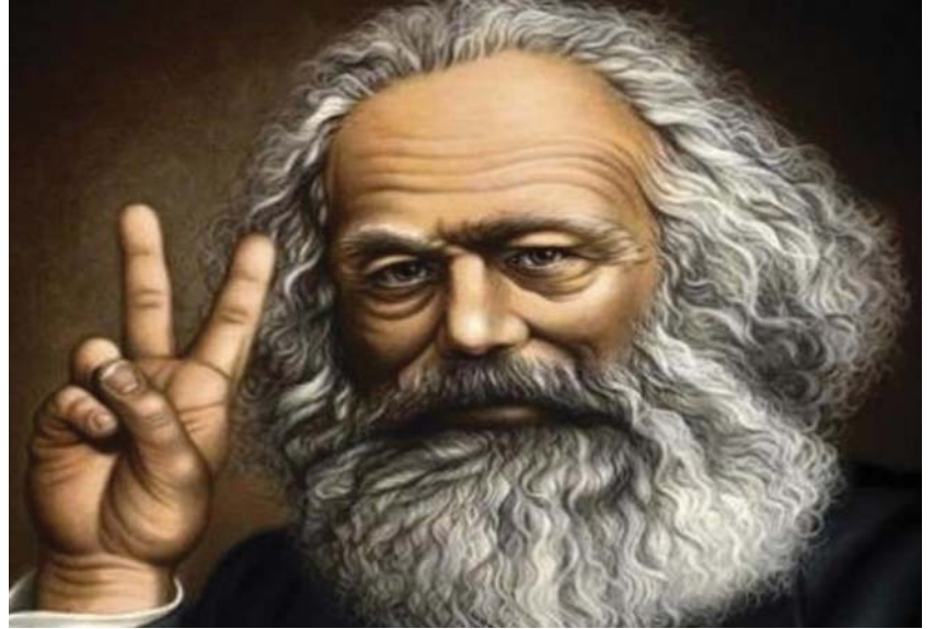
KARL MARX MAI ÁBRÁZOLÁSBAN

150 esztendeje, 1867. szeptember közepén jelent meg Karl Marx A tőke című művének első kötete. A tőke Marx (1818-1883) fő műve. Marx forradalmasította az emberek társadalmi kapcsolatainak vizsgálatát azzal, hogy kimutatta a gazdasági viszonyok meghatározó szerepét, s A tőkében feltárta a kapitalizmus gazdasági szerkezetét és gazdasági mozgástörvényét. Az objektív törvények által meghatározott, egy konkrét társadalmi alakulat: a kapitalizmus szabadversenyos szakasza keretében zajló emberi cselekvéseket belső összefüggésben álló rendszerként ábrázolta, s dialektikus fejlődési folyamatának sajátos módját nevezte e társadalom gazdasági mozgástörvényének. A kapitalizmus gazdasági mozgástörvényének feltárása – amit Marx A tőkében fő céljául tűzött ki és meg is valósított – tisztázta a munkásosztály számára a társadalmi fejlődés törvényszerűségét és megvalósulásának módját.