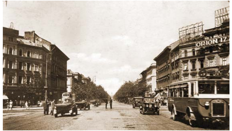
AZ OKTOGON 1929-BEN

Budapest tele van történelmi helyekkel, köztük számos olyan középülettel, amelyek a magyar munkásmozgalom történetéhez kötődnek. Az épületek funkciója többnyire már megváltozott. Esetenként az utcák és terek neve is megváltozott. Lassan elmennek azok, akik még felidézhetik a történelmet. Induljunk közös sétára! Mi marad a munkásmozgalmi Budapestből?