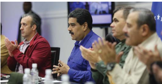
MADURO ELNÖK A KORMÁNY ÜLÉSÉN