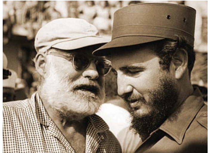
HEMINGWAY FIDEL CASTRÓVAL

Akárhogyan is volt, emlékezni fogunk az öreg halász történetére, aki napokon át küzd egy nagy halért. A harmadik napon sikerül elejteni a zsákmányt, és megindul a hazafelé fújó passzát szél is. Ám jönnek a cápák, s bár közülük hősies küzdelemben, minden erőtartalékának mozgósításával többet megöl az öreg, végül is a hajóhoz kötözött pusztá csontvázzal tér haza, önmaga meg szinte élőhalott már. Az első cápa megölése után mondja ki az öreg halász a mű szállóigévé vált gondolatát: „De hát az ember nem arra született, hogy legyőzzék – mondta. Az embert el lehet pusztítani, de nem lehet legyőzni.”