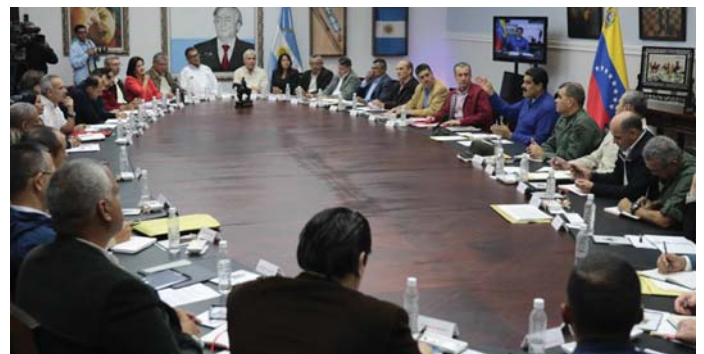
A VENEZUELAI KORMÁNY ÜLÉSE