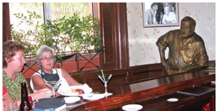
HEMINGWAY SZOBORKÉNT MOST IS JELEN VAN

A Magyar Munkáspárt központi politikai lapja. Szerkeszti a szerkesztőbizottság. Felelős szerkesztő: Frankfurter Zsuzsanna Szerkesztőség: 1046 Budapest, Munkácsy Mihály utca 51a.; telefon: (1) 787-8621; e-mail címe: info@aszabadsag.hu; internetcím: www.aszabadsag.hu