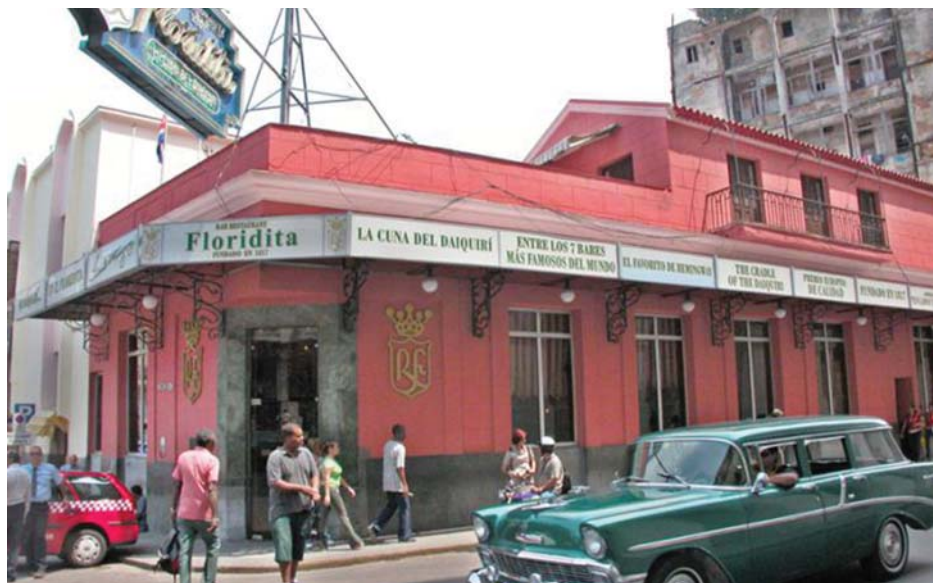
A FLORIDITA BÁR HAVANNÁBAN