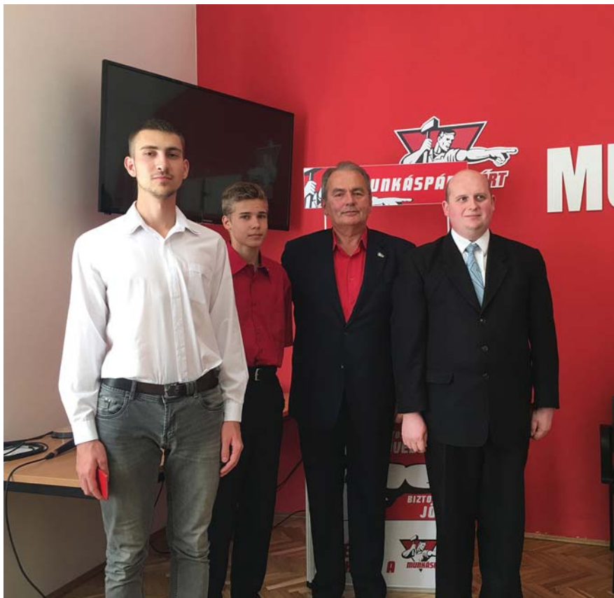
THÜRMER GYULA AZ ÚJ PÁRTTAGOKNAK NYÚJTOTT ÁT TAGKÖNYVEKET

A Munkáspárt elnöke elmondta, hogy a 2018-as választási program tartalmazza azokat a tételeket, amelyek mellett a Munkáspárt 27 éve következetesen kiáll. Követeljük az első munkahely, az első lakás biztosítását, az egészségügyi és oktatási kiadások megduplázását. Számos új elem is szerepel, amelyek választ adnak az emberek mai kérdéseire. A program a szerkesztési munka elvégzése után hamarosan bemutatásra kerül.