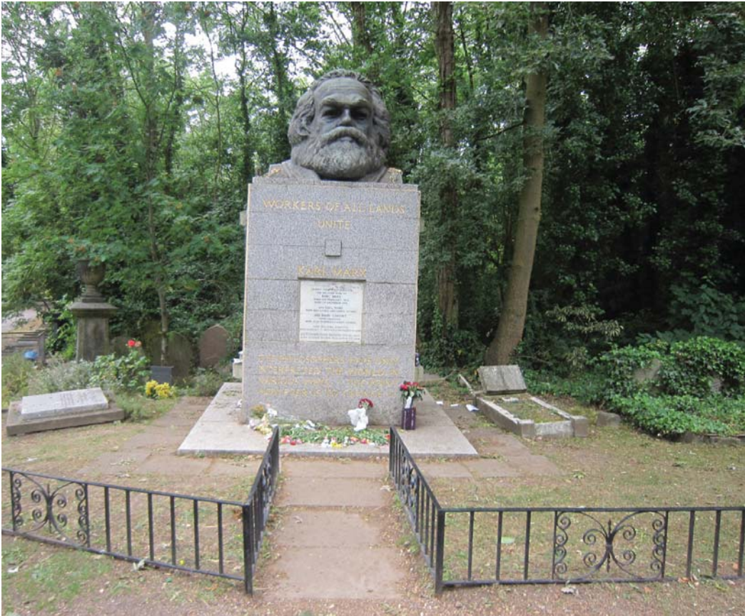
MARX SÍRJA LONDONBAN

A magántulajdonra épülő rendszer helyébe objektíve olyan rendszernek kell jönnie, amely teret ad a termelőerőknek. Lenin szavaival élve: „A tőkés rendszer, fokozva a munkásoknak a tőkétől való függését, létrehozta az egyesített munka óriási hatalmát. A kapitalizmus győzött az egész világon, de ez a győzelem csak bevezeti a munkának a tőke fölötti győzelmét.”