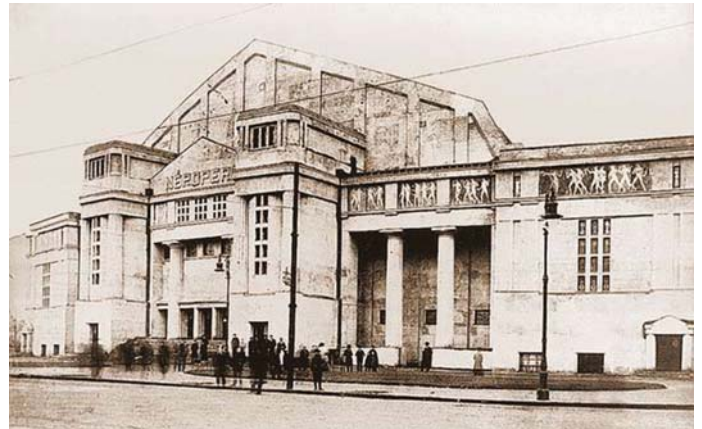
AZ ERKEL SZÍNHÁZ AZ ÁTADÁS UTÁNI ÉVEKBEN, MÉG NÉPOPERA NÉVEN