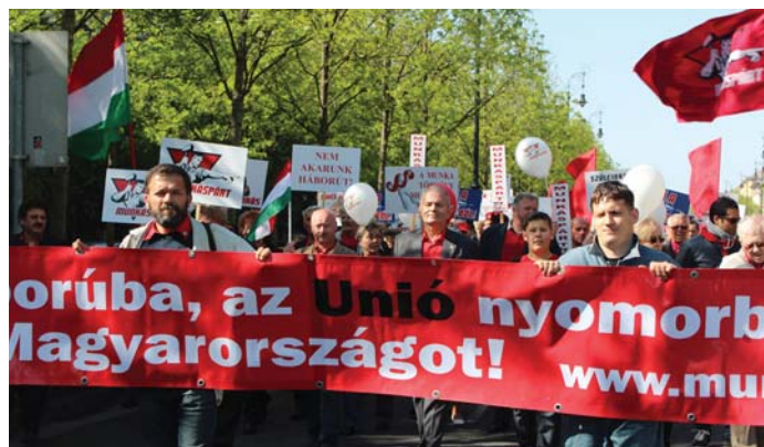
A MUNKÁSPÁRT MA IS FELVONUL MÁJUS ELSEJÉN, AZ MSZP MÁR RÉGEN NEM

Előnyünk nem származott, ettől előrébb nem jutottunk sem mi, sem az ország. Az MSZP nem baloldali párt. Nem a munkás-paraszt-dolgozó osztályokat képviseli. Nem a szocializmust, mint társadalmi rendszert tartja célravezetőnek, de még ideálisnak sem. Az MSZP egy simulékony tőkés párt. A mai szóhasználatban az érvényes rá: az MSZP egy szociáldemokrata párt.