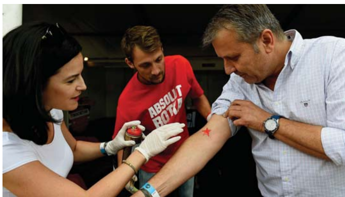
A BALOLDALISÁG CSAK REKLÁMFOGÁS

Emlékezzünk! Mit mondott Molnár Gyula, az MSZP akkori alelnöke, 17 éve, 2000 októberében?