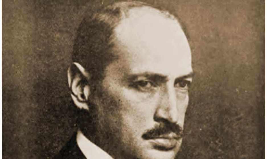
KÁROLYI MIHÁLY 1918-BAN

Az 1918-as nemzeti mozgalom nem tudta megoldani a földkérdést, jóllehet a nagybirtokos gróf kiosztotta kálkapolnai