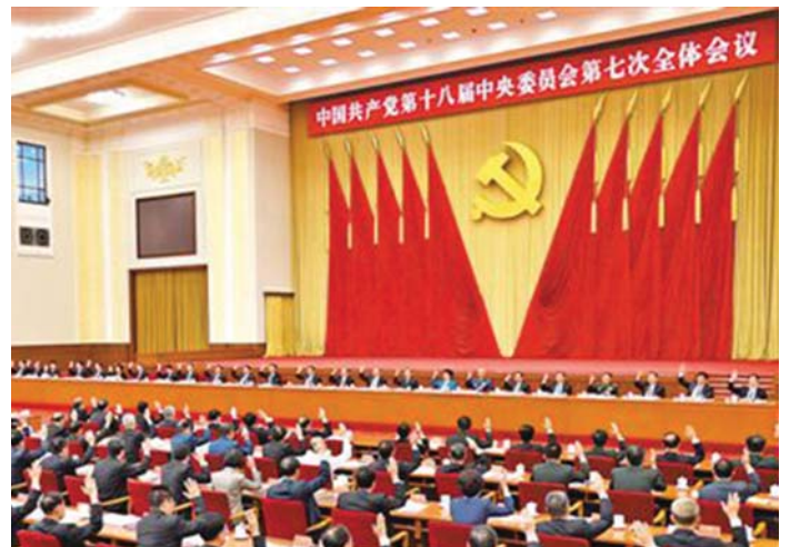
A KÍNAI KP KÖZPONTI BIZOTTSÁGA JÓVÁHAGYTA A KONGRESSZUSI ANYAGOKAT