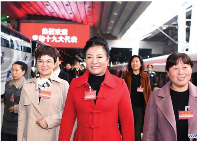
ÉRKEZNEK A KÜLDÖTTÉK A KÍNAI KP 19. NEMZETI KONGRESSZUSÁRA