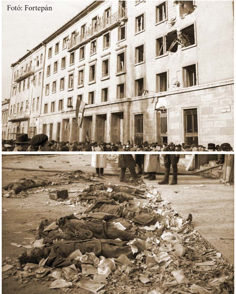
KÖNYÖRTELENÜL LEGYILKOLTÁK A PÁRTHÁZ VÉDŐIT