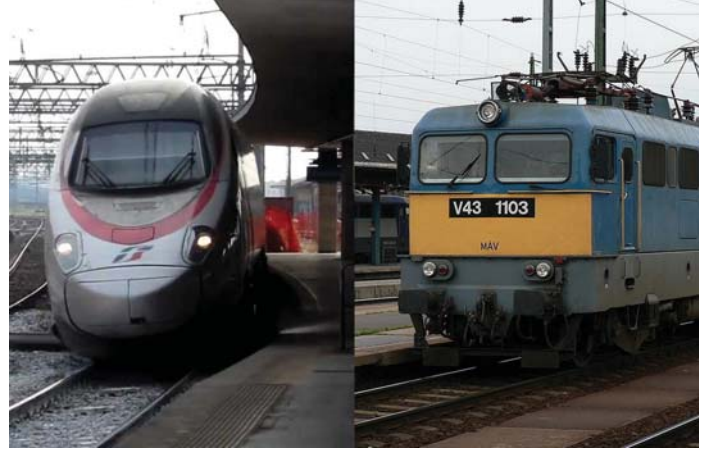
OLASZ VONAT - MAGYAR VONAT

Arányaiban elmondható, hogy azért a színvonalért, amit Magyarországon kapunk, nagyon sokat kell fizetnünk! Különösen, ha belegondolunk, hogy mennyit keresünk! Nálunk egy 150 000 forintos nettó fizetés nem számít kimondottan rossznak, nagy jóindulattal megtehetjük jelen esetben átlagnak. Ebből majdnem 21 alkalommal lehetne Nyíregyházára eljutni Győrből, vagy fordítva. Olaszországban egy 1500 eurós, 450 000 forintos fizetés szintén nem számít kifejezetten rossznak,