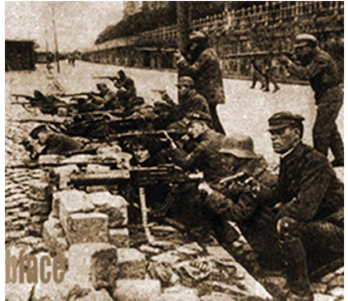
A SZOVJETHÁZ VÉDŐI

De hol is van ez a bizonyos „szovjetház”? Ma már nem látható. Ma a Hotel Intercontinental áll a helyén, rögtön a Lánchíd pesti hídfőjénél, az Eötvös-szobor mögött. A második világháború