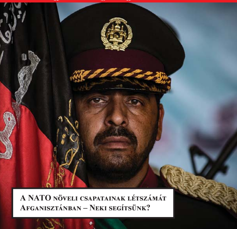
A NATO NÖVELI CSAPATAINAK LÉTSZÁMÁT AFGANISZTÁNBAN – NEKI SEGÍTSÜNK?