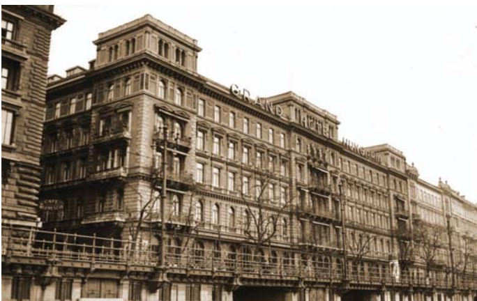
AZ EGYKORI HUNGÁRIA

Kun Béla, illetve a népbiztosok családtagjaikkal augusztus 1-jén késő este vonattal hagyták el Budapestet, és másnap hajnalban lépték át az osztrák határt. Korányi Frigyes, későbbi pénzügyminiszter a Tanácsköztársaság bukása után elismerte, hogy a bankszéfeket sértetlenül adták vissza. A proletárhatalom nemhogy nem lopott, de megőrizték azt a több mint 90 millió értékű aranykészletet, melyet 1918 októberében a közös bank osztrák vezérkara Bécsbe kívánt szállítani.