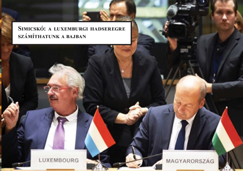
SIMICKÓ: A LUXEMBURGI HADSEREGRE SZÁMÍTHATUNK A BAJBAN