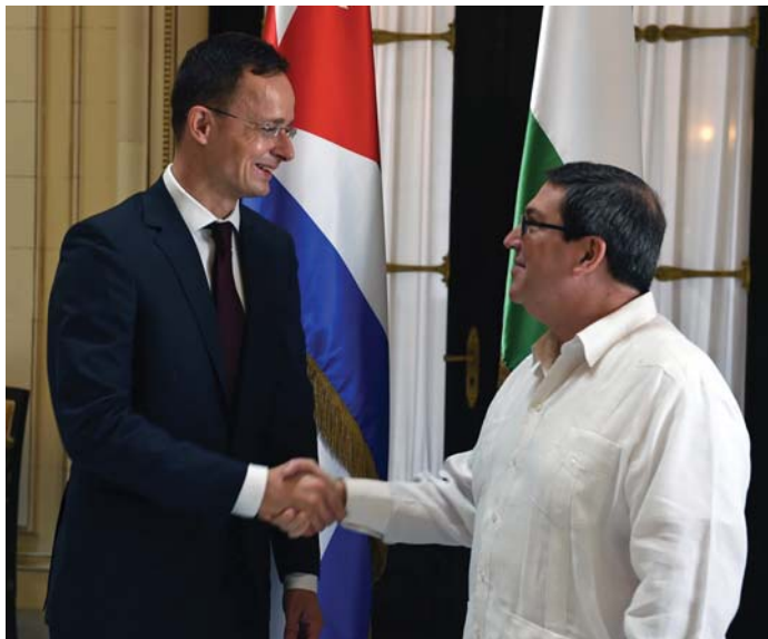
MAGYAR-KUBAI KÜLÜGYMINISZTERI TALÁLKOZÓ

A kubai gazdaság modernizációja nagyon komoly lehetőséget nyújt a magyar vállalatok számára, hogy az egyre inkább kinyíló piacon megvessék a lábukat és aztán profitra tegyenek szert – mondta az MTI-nek Szijjártó Péter külgazdasági és külügyminiszter, aki november 8-9-én kétnapos látogatást tett Kubában.