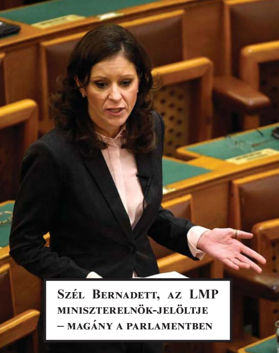
SZÉL BERNADETT, AZ LMP MINISZTERELNÖK-JELŐLTJE – MAGÁNY A PARLAMENTBEN