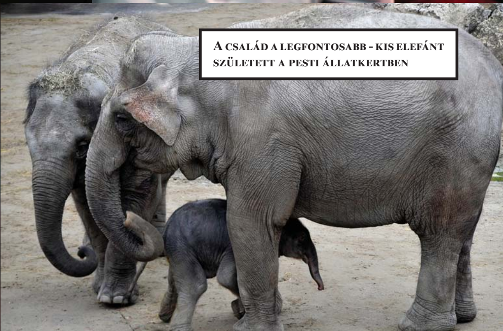
A CSALÁD A LEGFONTOSABB - KIS ELEFÁNT SZÜLETETT A PESTI ÁLLATKERTBEN