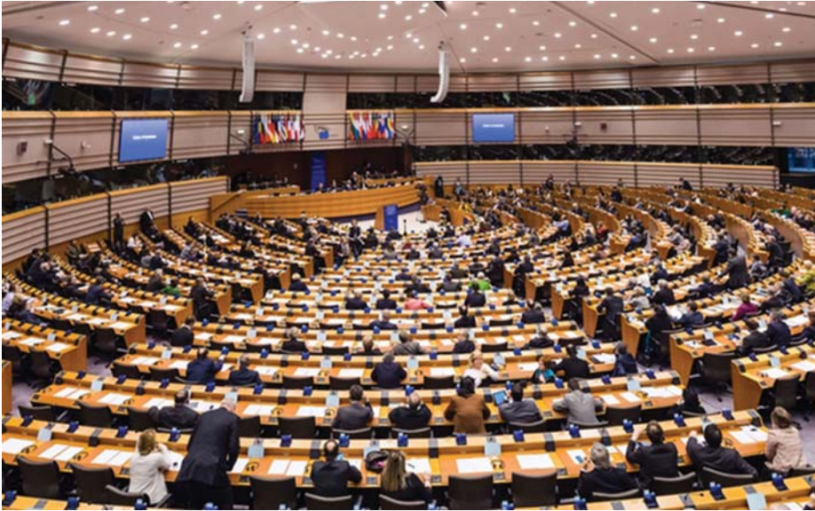
EURÓPAI PARLAMENT - A DEMOKRÁCIA LÁTSZATA

a tagállamok illetékes hatóságai hitelesítik az online gyűjtési rendszert. Függetlenül attól, hogy a támogató nyilatkozatok gyűjtése papíron vagy elektronikus formában történik-e, ellenőrzéskor mindkét gyűjtési forma esetében azonosak az adatokra vonatkozó követelmények. Kilenc tagállam nem kér személyi azonosító okmányt vagy számot az európai polgári kezdeményezés támogatóitól. Az összes többi tagország azonban megköveteli ezt.