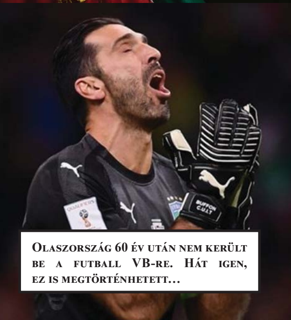
OLASZORSZÁG 60 ÉV UTÁN NEM KERÜLT BE A FUTBALL VB-RE. HÁT IGEN, EZ IS MEGTÖRTÉNHESETT...