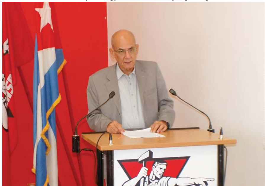
KUBA BÚCSÚZÓ NAGYKÖVETE

Köszönjük, Nagykövet Elvtárs, és jó egészséget!