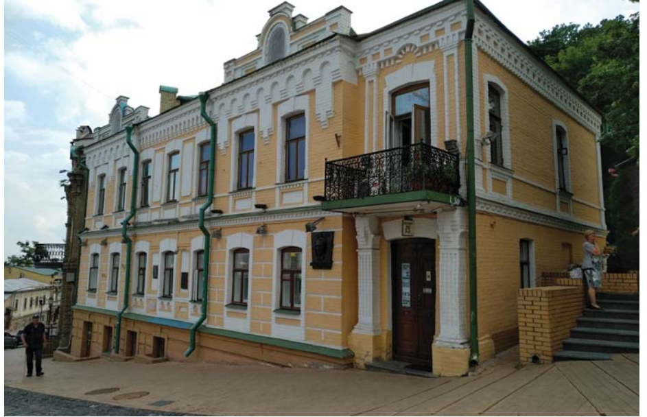
A BULGAKOV-HÁZ KIJEBEN

Az utcán, a magánüzletek, kávézók előtt általában rend van. A tőkés ügyel a tulajdonára, meg a tisztaságra is. Ami viszont köztulajdonban van, vagy amire a köznek költenie kellene, iszonyú! Az utak borzalmasok! Hepehupás utak a belvárosban, feltöredezett járdák. A belvárostól pár kilométerre sötét utcák, gondozatlan parkok.