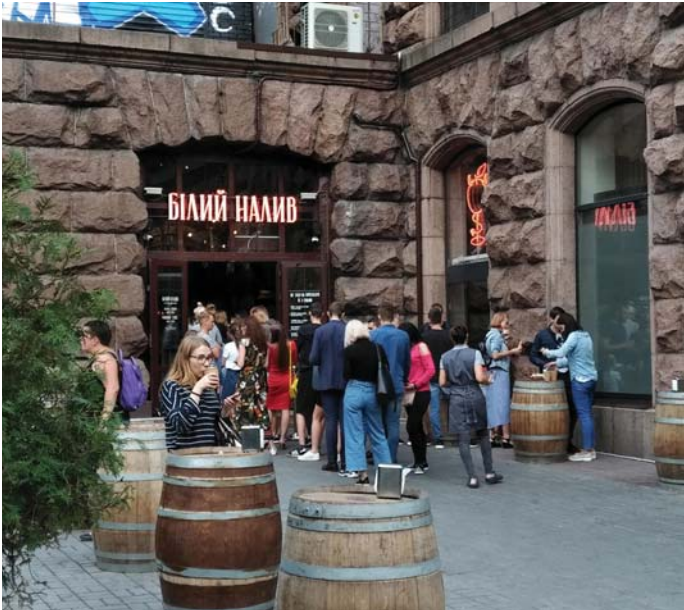
FIATALOK SÖRÖZNEK KIJEV BELVÁROSÁBAN

Egyébként a hrivnya is az „oroszmentesítés” terméke. A rubelt leváltották, és 1996-ban előrántották a nagyon távoli múltból a hrivnyát. A bankjegyek egyénként szépek, mutatósak.