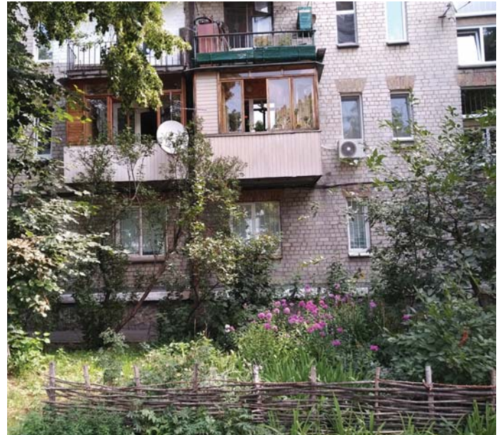
MAGUKRA HAGYOTT LAKÓTELEPI HÁZAK

őszén Kijevet. Itt halt bele a sebesülésébe, és itt temettek él. 41 éves volt.