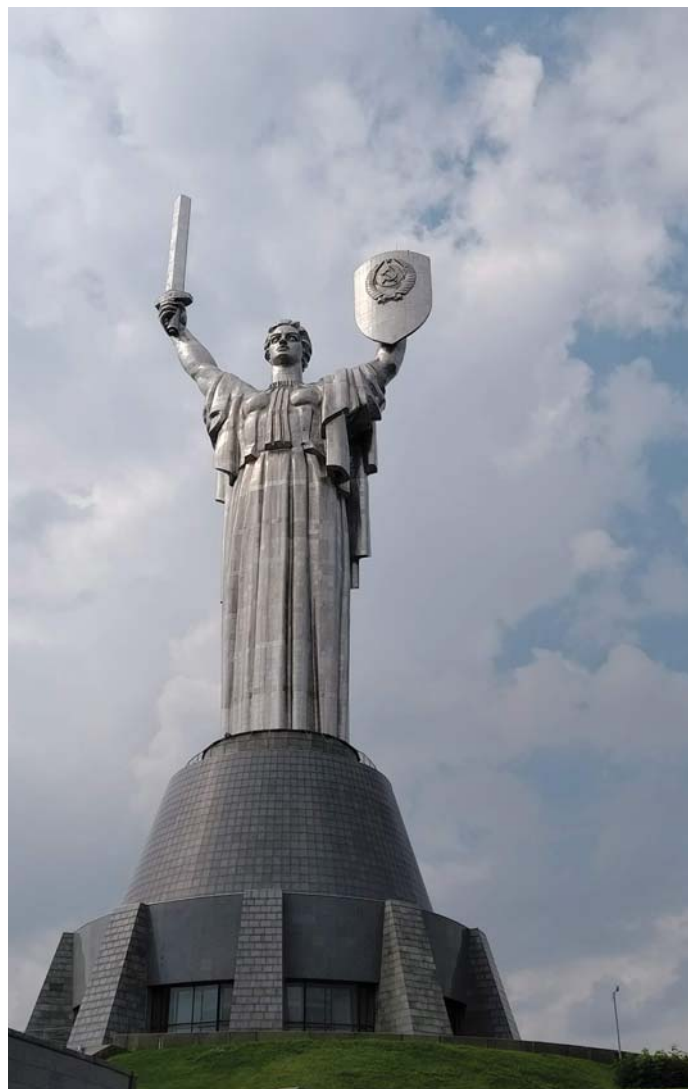
A DICSŐSÉG EMLÉKMŰ

és az orosz is ukránt. De a fő ok, hogy szinte mindenki beszél oroszul. Kijevben minden ukránul van kiírva, a metróban ukránul, ja, és persze, angolul mondják be az állomásokat, de az utcán alig hallani ukrán szót. Oroszul beszélnek.