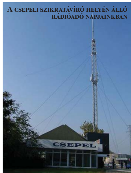
A CSEPELI SZIKRATÁVÍRÓ HELYÉN ÁLLÓ RÁDIÓADÓ NAPJAINKBAN

Kun ekkor a kormány ülésén volt, helyette Poór Ernő, az egyik népbiztos válaszolt: „A magyar proletariátus, amely tegnap éjszaka az egész államhatalmat meghódította, bevezette a proletariátus diktatúráját és üdvözlí önt, mint a nemzetközi proletariátus vezetőjét. Adja át' ön forradalmi szolidaritásunkat és üdvözetünket az egész forradalmi orosz proletariátusnak. A szociáldemokraták pártja a kommunisták álláspontjára helyezkedett... A magyar tanácsköztársaság kéri az orosz szovjetkormány véd- és dacsövetségét. Fegyverrel kezünkben fordulunk szembe a proletariátus valamennyi ellenségével és kérünk azonnali értesítést a katonai helyzetről.”