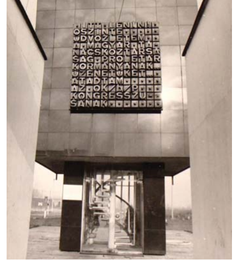
A CSEPELI SZIKRATÁVÍRÓ EMLÉKMŰVE EGYKOR

Leninnek ekkorra már bőséges tapasztalata volt arról, hogy a szociáldemokraták milyen tévedéseket követnek el, sőt milyen aljasságokra képesek. Kun Bélának ilyen tapasztalatuk kevés volt. Ráadásul a Kommunisták Magyarországi Pártjában korábbi szociáldemokraták is részt vettek. Maga a Tanácsköztársaság kikiáltása a szociáldemokraták és a kommunisták megegyezése alapján történt. Ennek egyik aktusa volt az alig négy hónapos múltra visszatekintő kommunista párt és a sok évtizedes tapasztalattal rendelkező MSZDP egyesülése. Lenin aggodalmának tehát igen reális okai voltak. A szociáldemokraták