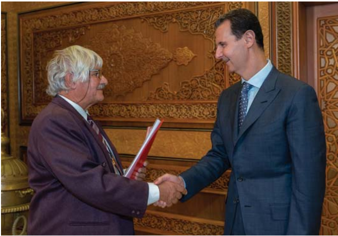
BENYOVSZKY GÁBOR ÉS BASSÁR EL-ASZAD ELNÖK

A Világ Béketanács (WPC), a Demokratikus Fiatalok Világszövetsége (WFDY), a Szíriai Diák Unió (NUSS), a szíriai Nemzeti Békepartizán Mozgalom Tanácsa (NCPMMS) szolidaritási konferenciát rendezett Damaszkuszban. A konferencia megszervezését a Fórum Szíriáért Egyesület és a Magyarországon Tanuló Szíriai Diákok Egyesülete támogatta.