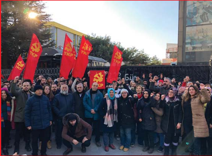
A TÖRÖK KP ÉV VÉGI TŰNTETÉSE