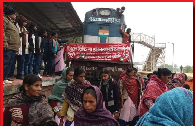
AZ INDIAI KP AZ OLCSÓBB VASÚTÉRT TŰNTETETT