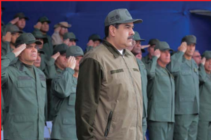
VENEZUELA NÉPE MADURO ELNÖK VEZETÉSÉVEL KEMÉNY HARCRA KÉSZÜL