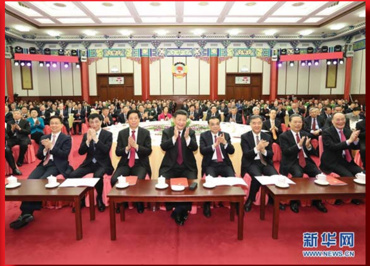
A KÍNAI KP KÖZPONTI BIZOTTSÁGA ÜNNEPELT