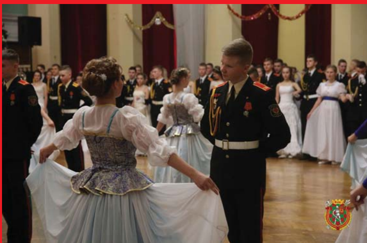
A MINSZKI SZUWOROV KATONAI KÖZÉPISKOLA ÚJÉVI BÁLJA