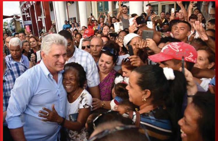
KUBA A FORRADALOM GYŐZELMÉT ÜNNEPELI