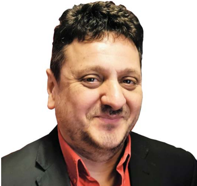
VASUTAS ÉS SZAKSZERVEZETI AKTIVISTA

1. A tőke és a dolgozók közötti osztályharc új dimenziót kapott. A Szovjetunió mellett egész sor szocialista ország jött létre Kelet-Európa államaiban, így Magyarországon is, majd Kínában és Koreában. A szocialista világ léte már nem csak a forradalom lángját mutatta fel, hanem osztályharcra ösztönözte a nyugati dolgozó osztályokat is.